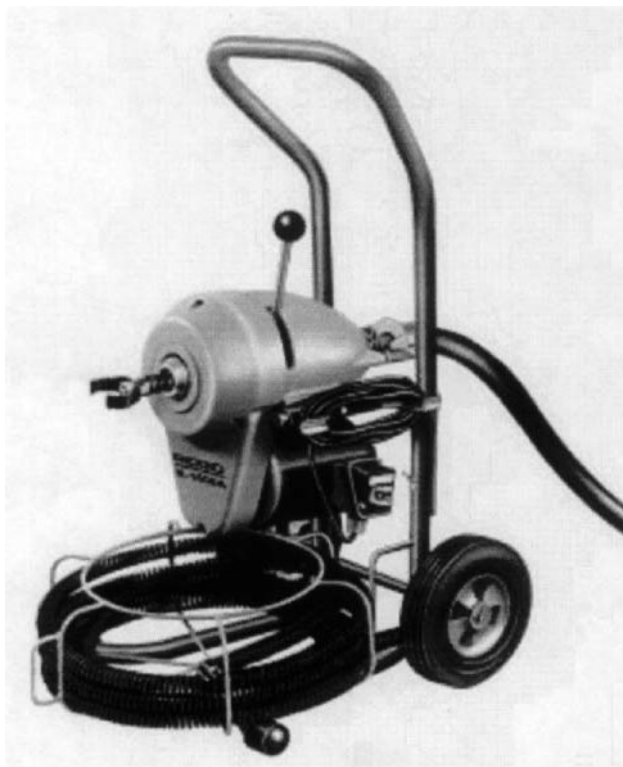
Рис. 3: Хранение тросов

ВНИМАНИЕ: После использования тщательно промойте тросы и соединительные муфты водой и просушите их, поскольку некоторые химические соединения для чистки канализации обладают разрушающим действием.