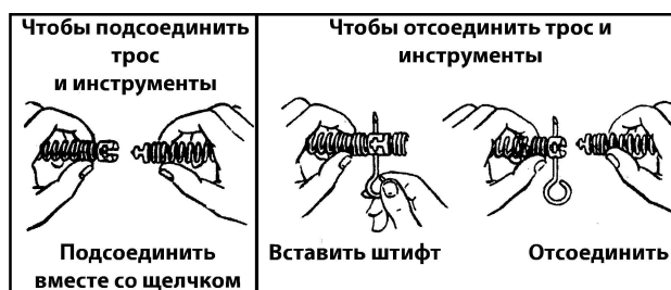
Рис. 1: Соединение и разъединение тросов и инструментов

ПРИМЕЧАНИЕ! Быстросъемный соединитель (рис. 1) обеспечивает самый простой способ смены инструментов и тросов. Быстросъемные соединители можно устанавливать дополнительно на все существующие инструменты и тросы.