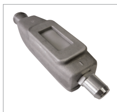
Алюминиевый корпус выключателя