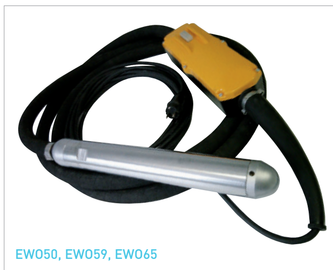
EWO50, EWO59, EWO65