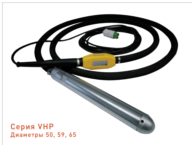
Серия VHP Диаметры 50, 59, 65