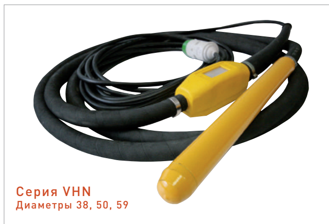
Серия VHN Диаметры 38, 50, 59