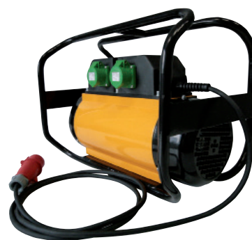
CM 25T- 25M