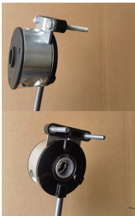
Рис 6 – В рабочем положении, подаваемая вручную спираль