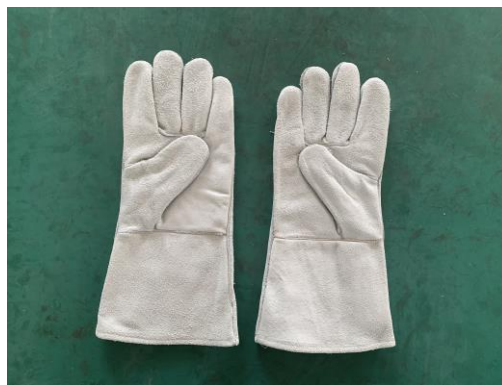
Рис. 4 – Перчатки для чистки канализации HONGLI