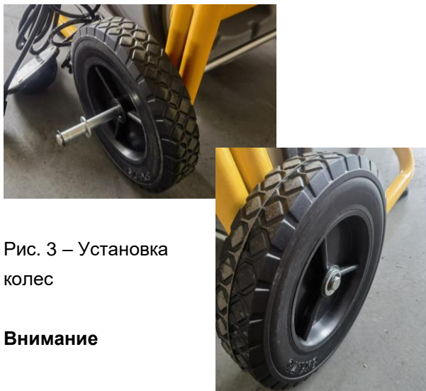
Рис. 3 – Установка колес