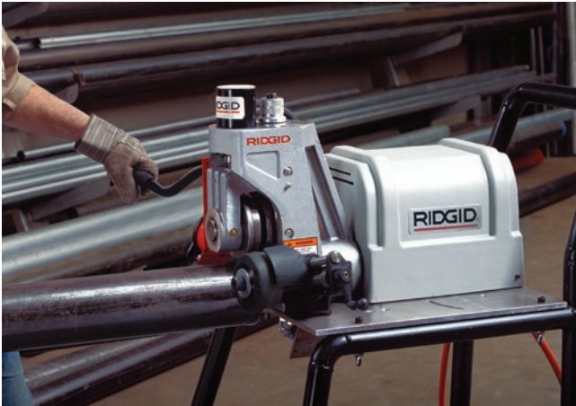
Модель 918, информация для заказа и принадлежности